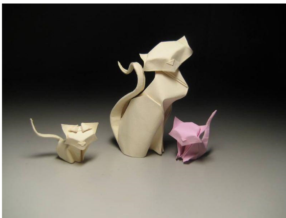
Рисунок 4. Мокрое складывание