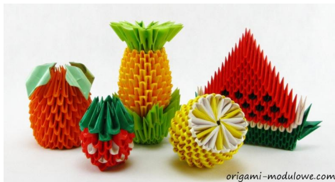
Рисунок 2. Модульное оригами.